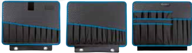
117.18/P-G 42 poches à outils + 67 boucles d'outils