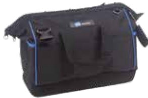
1 116.03 – 15 poches à outils + 23 boucles d'outils