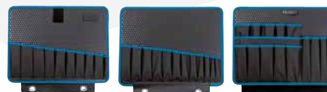
117.17/P 34 poches à outils + 25 boucles d'outils