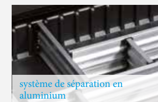
système de séparation en aluminium