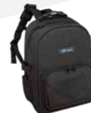
① 116.02 – 16 poches à outils + 2 lignes boucles d'outils