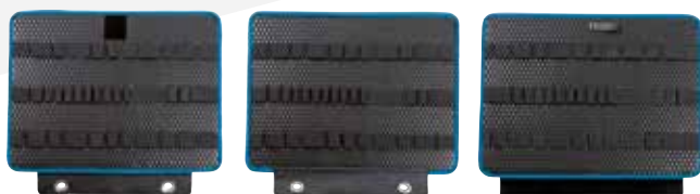
117.16/L 32 boucles d'outils