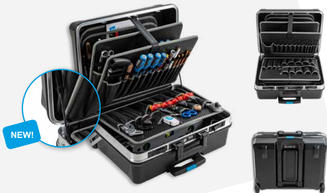
115.05/P-G 61 poches à outils