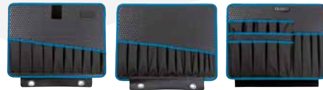
117.19/P-G 45 poches à outils + 94 boucles d'outils