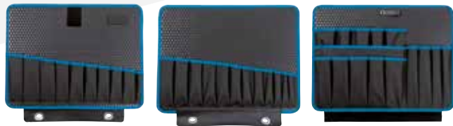
117.20/P-G 20 poches à outils + 16 boucles d'outils