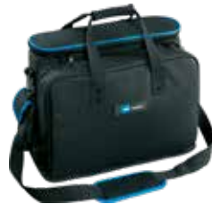
① 116.01 – 23 poches à outils + 2 rows boucles d'outils