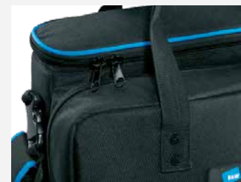
fermetures éclair de haute qualité