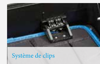
Système de clips