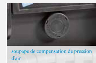
soupape de compensation de pression d'air