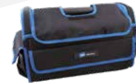
1 116.04 – 15 poches à outils + 8 boucles d'outils